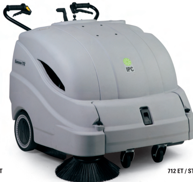
712 ET / ST