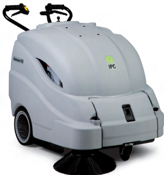
512 ET / ST